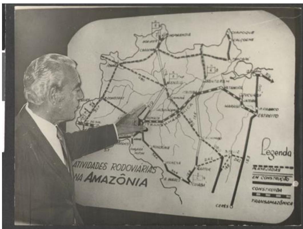
Figura 3 - Os traçados da rodovia na Amazônia