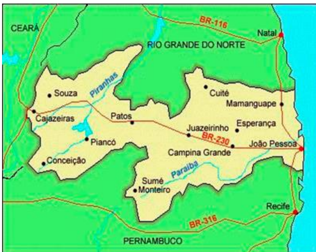
Figura 6 - Mapa da rodovia na Paraíba

extensão, o fim da sua pavimentação está previsto para dezembro de 2022. Dados SIGA-DER/PB. Na Figura 6 é possível ver o Mapa da Paraíba e por onde a rodovia percorre