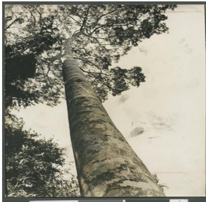
Figura 4 - Exemplo de árvore de 60 metros que foram derrubadas

O plano original era conectar o Oceano Atlântico com o Oceano Pacífico por uma rota de 8.000 km que atravessava toda a América do Sul. Mas o projeto foi modificado para um modelo que pudesse atingir as fronteiras do Brasil e do Peru, o que também não aconteceu. O problema era que a construção só começou quatro meses depois da visita dos Médici ao Recife. Naquela época, os ambientalistas eram escassos e a extração de madeira não era um problema. Durante a construção, várias árvores de 60 metros de altura foram cortadas, de acordo com o Arquivo Nacional.