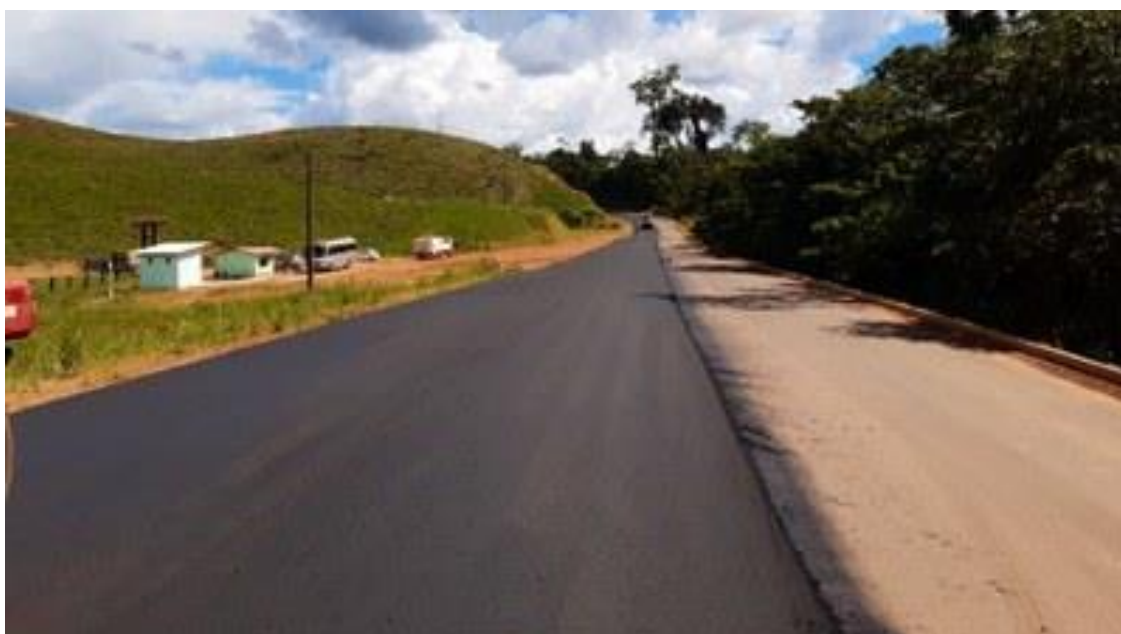
Figura 10 - Trecho pavimentado

Grande parte das viagens em rodovias no Brasil com a Transamazônica diminuiria o tempo de estrada e reduziria os custos de transporte, deixando muito mais rápido e prático qualquer circulação em território nacional, como foi dito anteriormente. O modal Rodoviário é extremamente importante para o desenvolvimento econômico do país, sem dúvidas é essencial que tenha um investimento nesse setor. É difícil ter um projeto que deveria se tornar um dos maiores avanços do país, onde só beneficiaria a população, tanto passageiros em viagens como trabalhadores caminhoneiros, mas se tornou um dos maiores problemas que temos no Brasil atualmente, bilhões e bilhões de dinheiro público desperdiçados nesta obra inacabada.