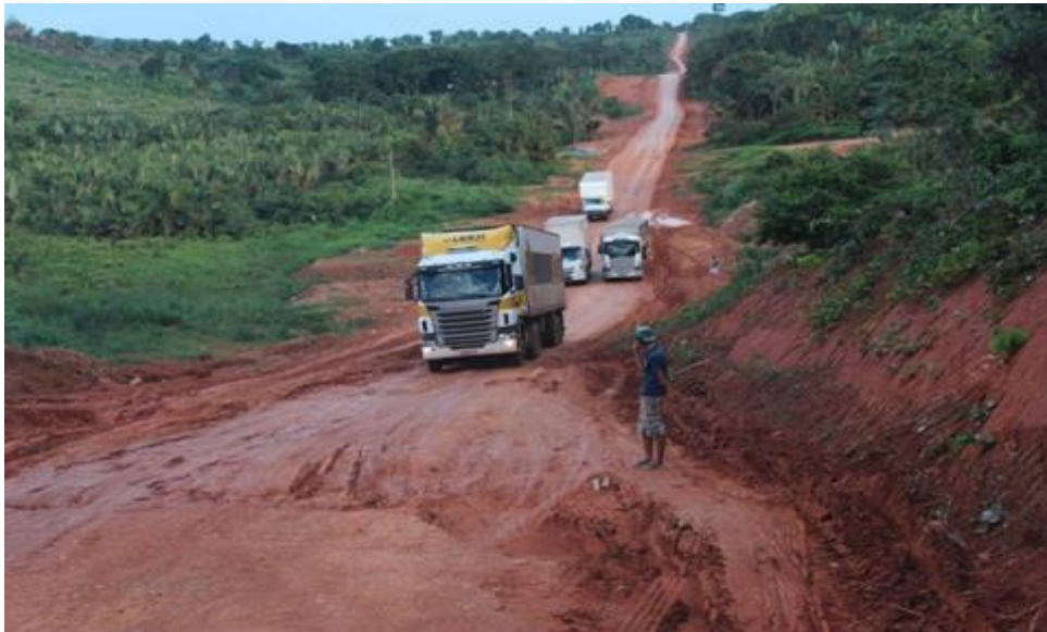
Figura 5 - Trecho de estrada não pavimentada pós chuva