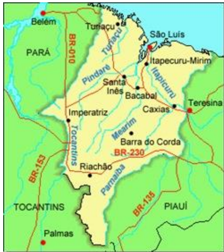
Figura 7 - Mapa da rodovia no Maranhão