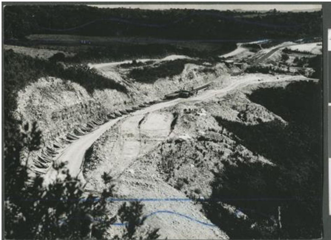
Figura 2 - Trecho da BR-230 em construção por volta dos anos 70