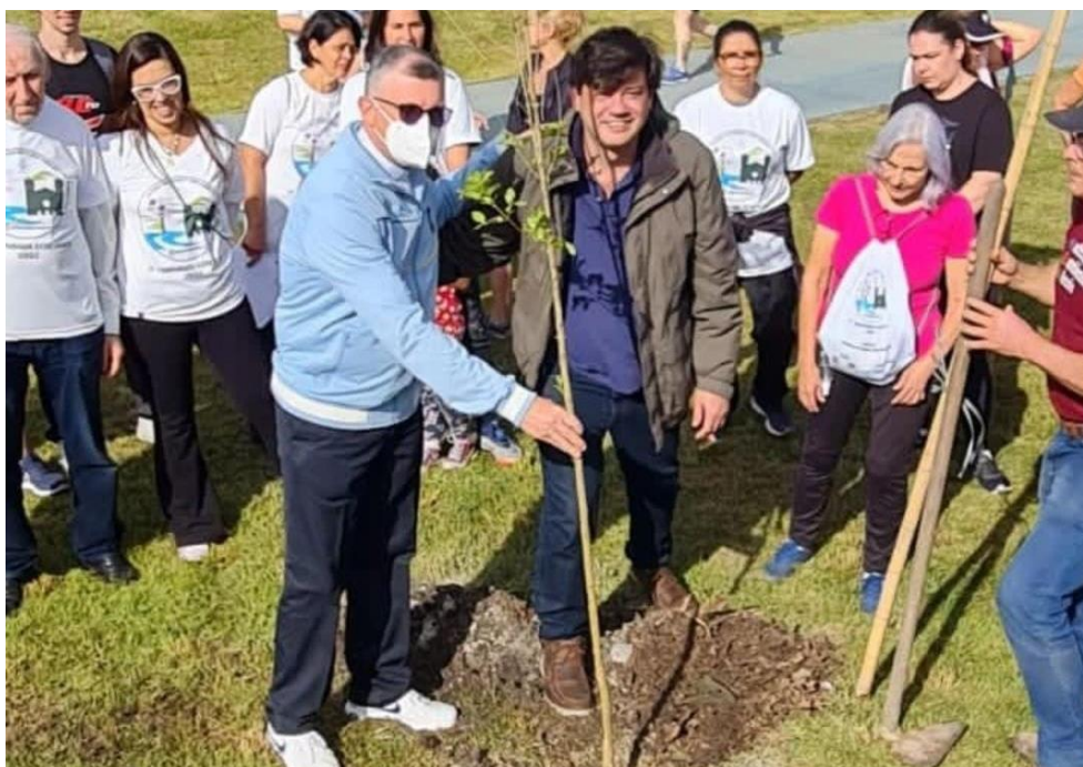
Figura 19 - Projeto Caminha

Através da colaboração do Instituto com o fornecimento de algumas informações, pudemos inteirar-se acerca do projeto. Localizado em Suzano, São Paulo, o Instituto Agroterra é uma ONG que realiza "projetos de educação ambiental e agroecologia em periferias, hortas urbanas sustentáveis, gerando renda e alimentação saudável para as famílias de baixa renda", como é dito no próprio site.