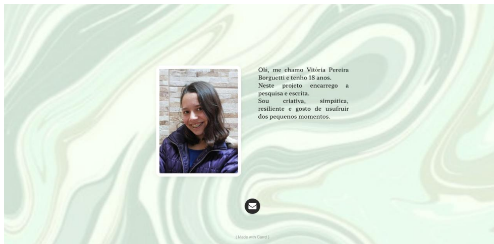
Figura 9 - Website - Participantes (Vitória)