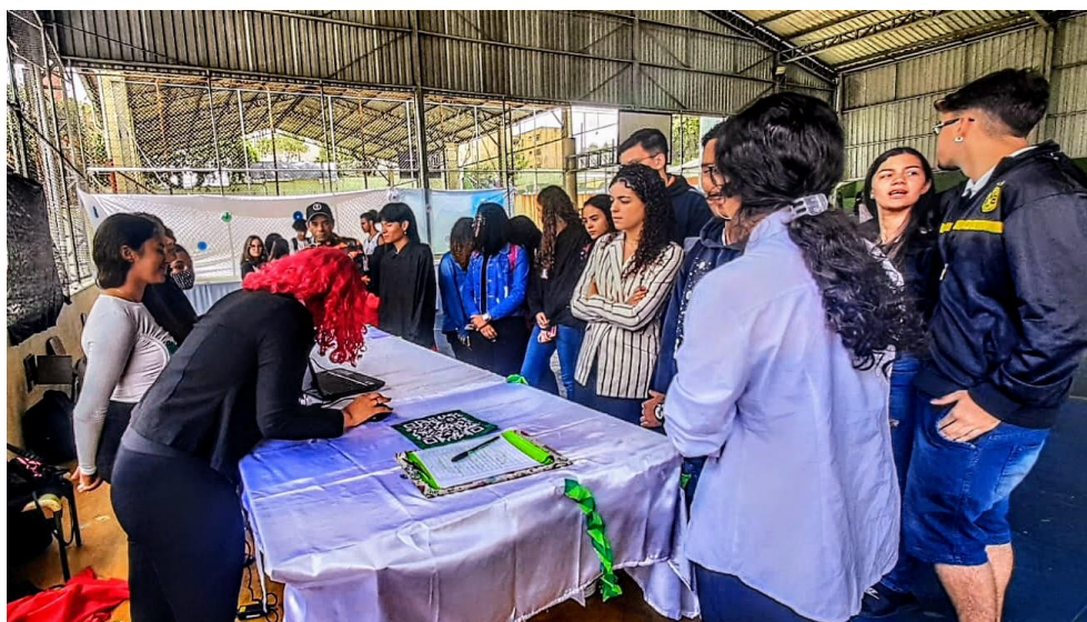
Figura 28 - Feira Tecnológica - Exibição