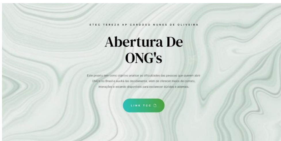
Figura 1 - Website - Layout

dispositivos móveis, ou seja, projetado para funcionar bem em aparelhos eletrônicos de comunicação portátil, garantindo uma experiência de navegação positiva.