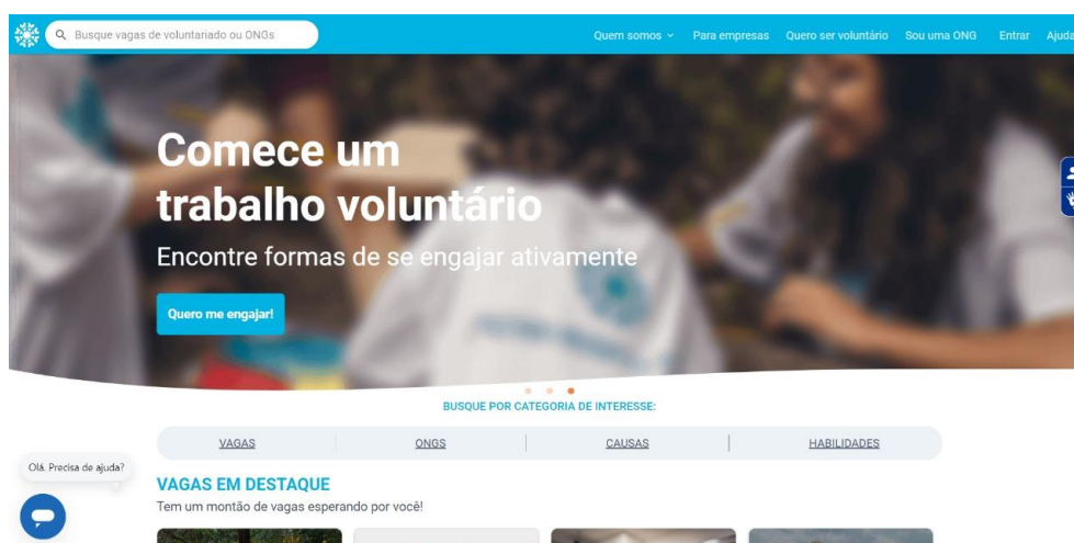
Figura 16 - Atados - Vagas