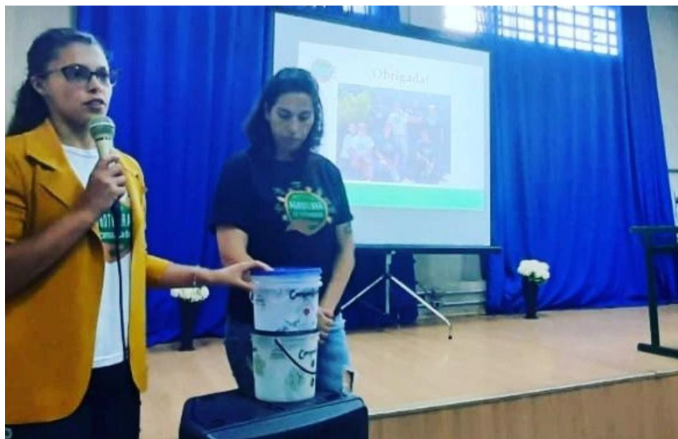
Figura 22 - Palestra Agroterra ETEC