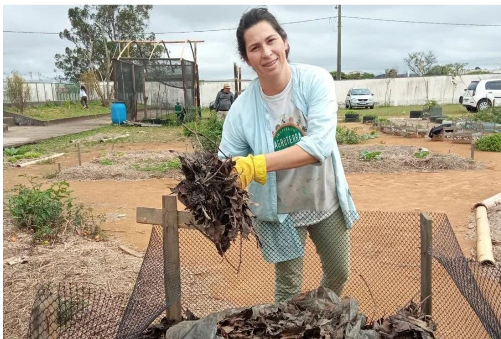
Figura 20 - Compostagem Agroterra

está incluso no projeto, o exercer a cidadania e o engajamento das mulheres, das crianças e dos jovens nos objetivos, onde buscam trazer a participação, colaboração e conscientização de todos, assim como na participação na compostagem de comida orgânica.