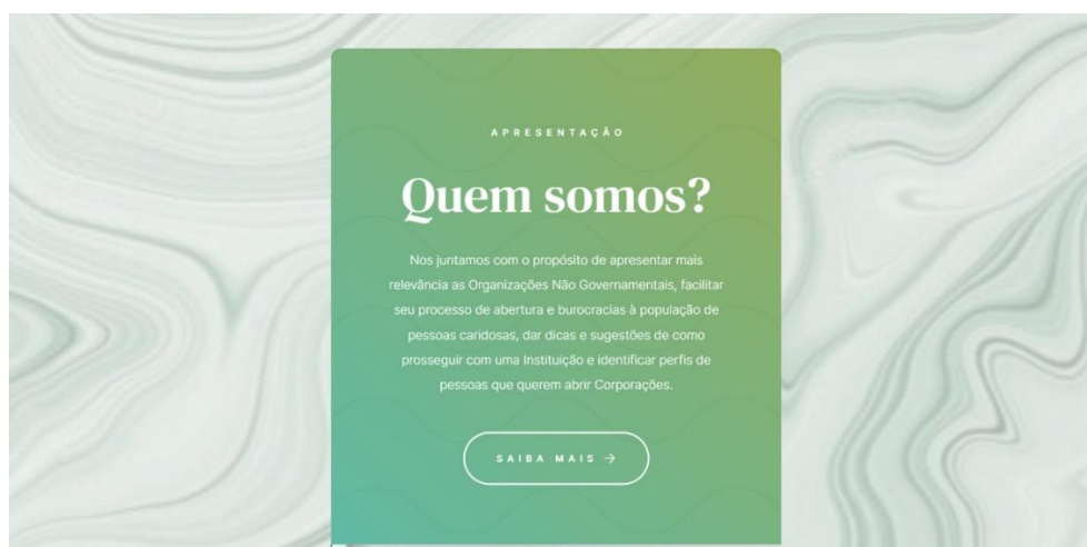
Figura 2 - Website - Apresentação