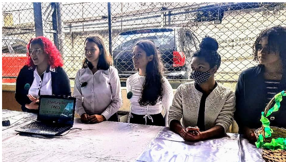
Figura 29 - Feira Tecnológica - Corporação