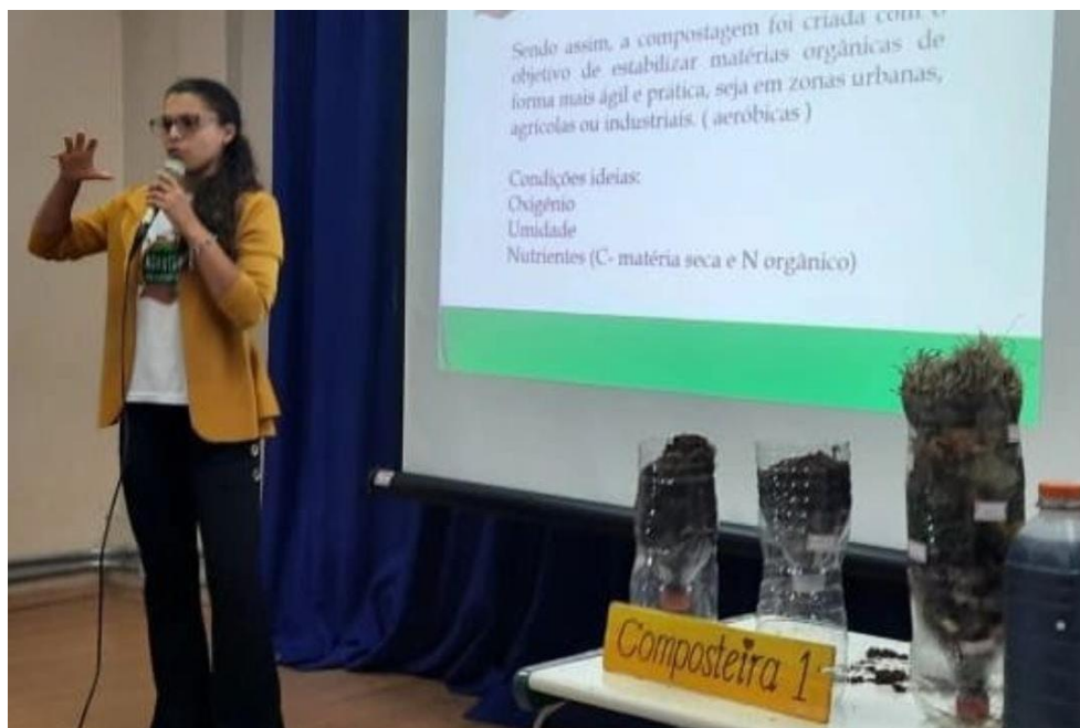
Figura 21 - Palestra Agroterra ETEC