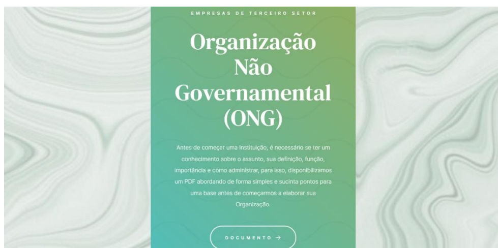
Figura 10 - Website - Empresas de Terceiro Setor