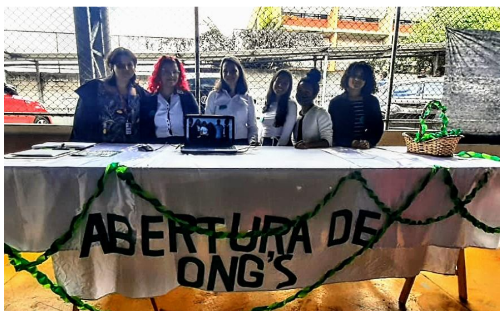
Figura 30 - Feira Tecnológica - Orientadora