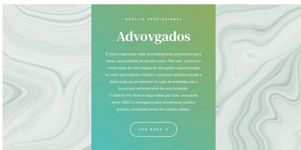
Figura 13 - Website - Auxílio Profissional