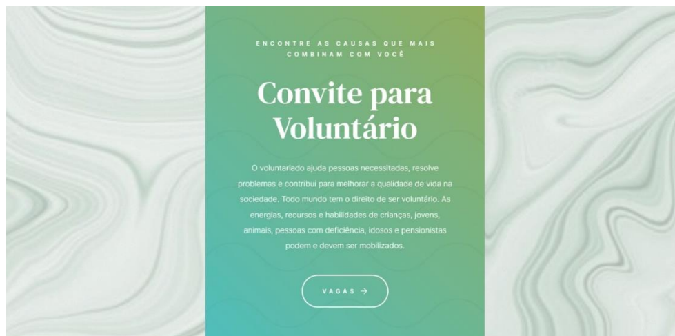
Figura 15 - Website - Convite para Voluntariado