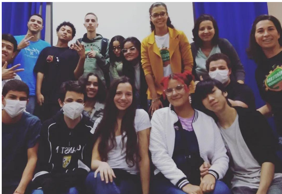
Figura 23 - Foto da Turma - Palestra Agroterra