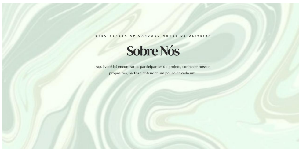
Figura 3 - Website - Sobre Nós