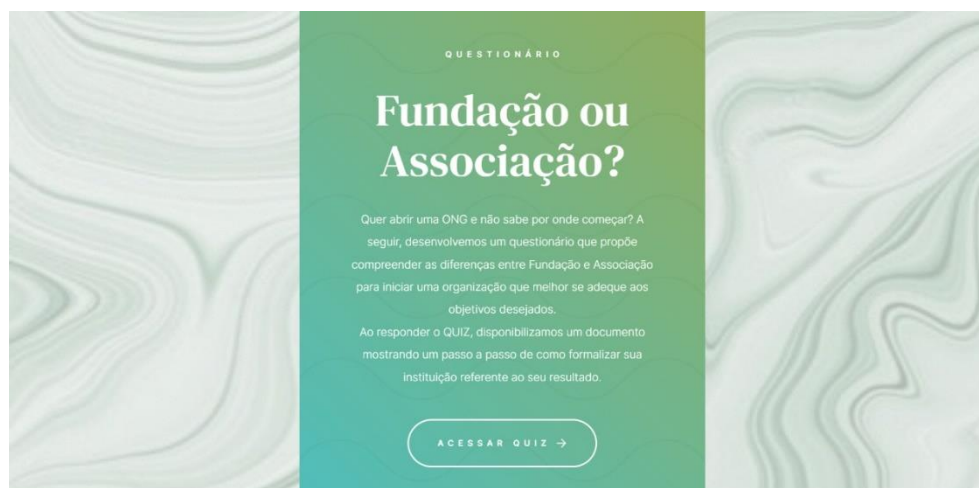
Figura 11 - Website - Questionário