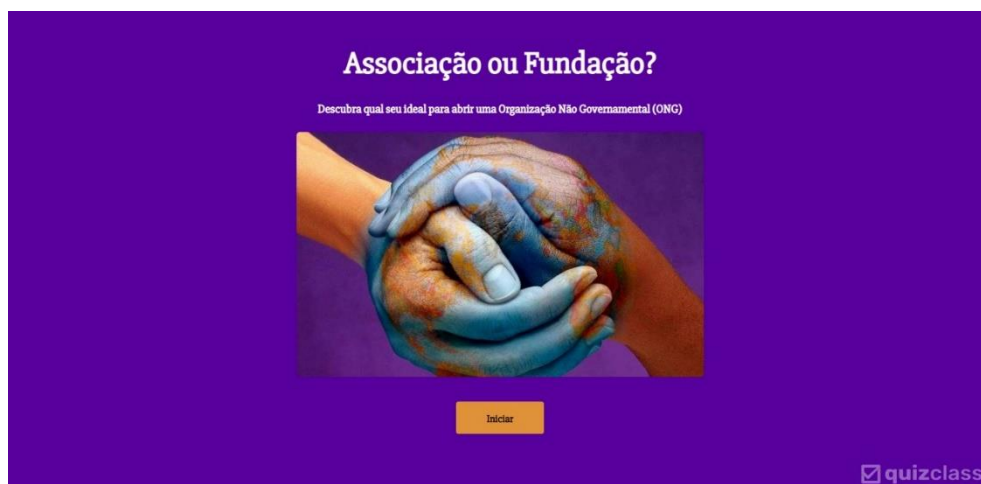
Figura 12 - Quizclass - Associação ou Fundação