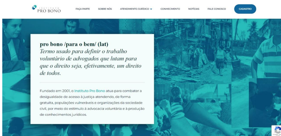
Figura 14 - Pro Bono - Instituto