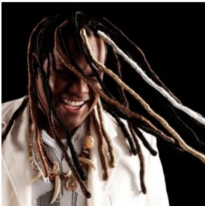
Figura 3 Beleza e Felicidade Negra

firme tradução dos penteados e costumes da cultura africana espalhados pelo mundo afora, mas que, também, ganha contornos de resistência e de beleza negra.