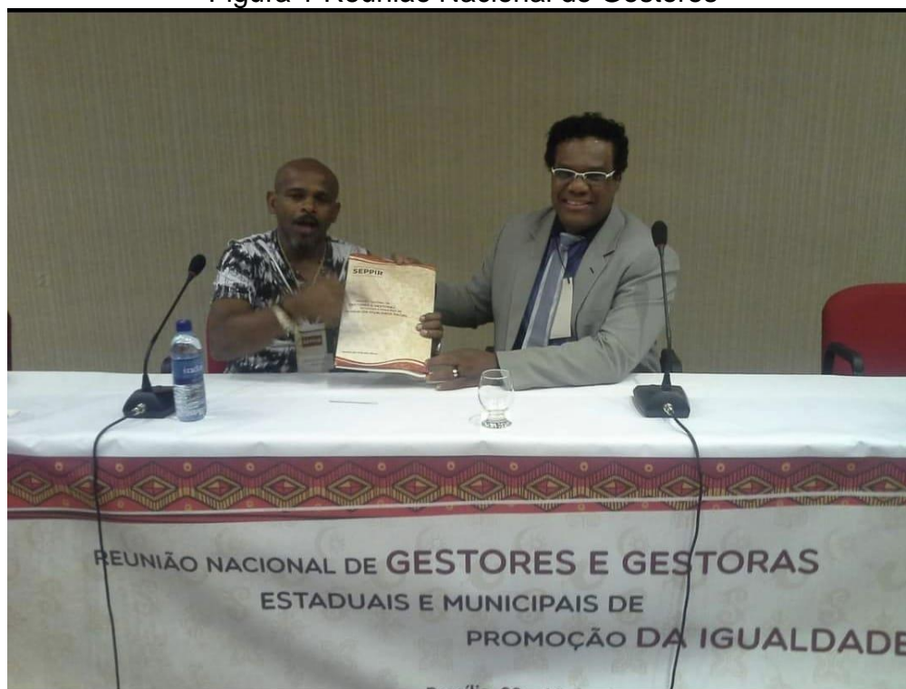
Figura 1 Reunião Nacional de Gestores