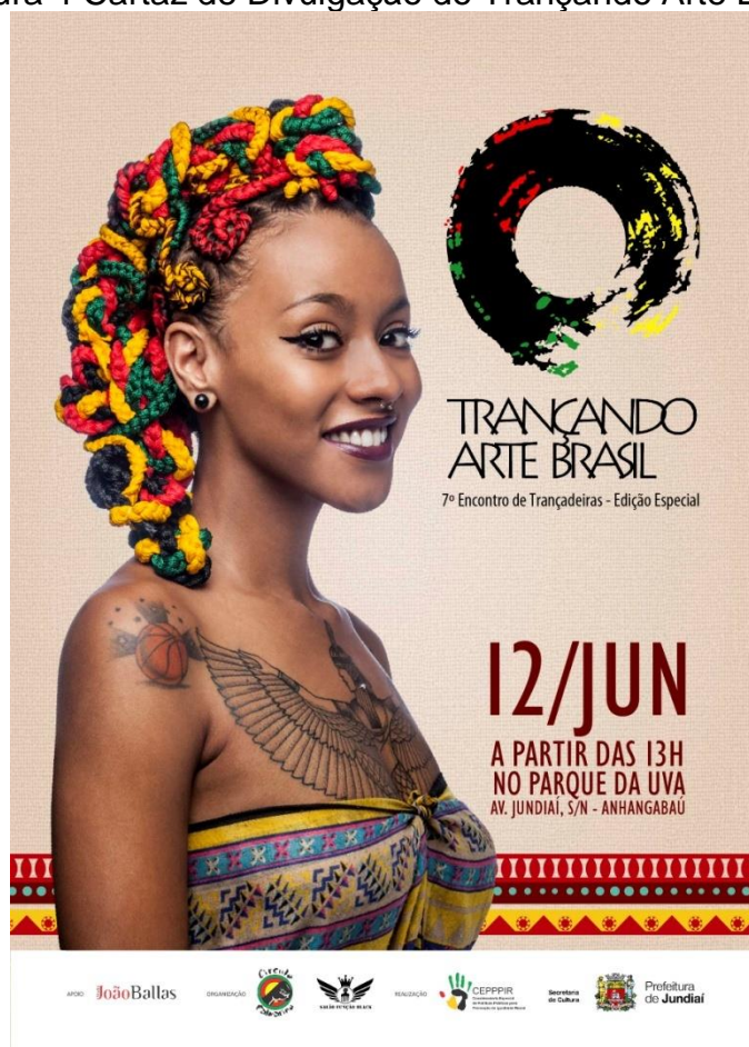
Figura 4 Cartaz de Divulgação do Trançando Arte Brasil

Foram meses de antecipação para que se chegasse ao resultado desejado, pensar em cada detalhe do evento é o grande diferencial dos organizadores, seja na escolha da modelo, maquiagem, penteados, ou mesmo nas cores das tranças, conforme demonstrado na figura4.