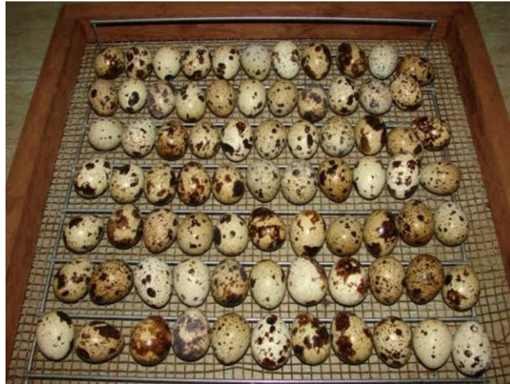
Figura X: Incubação dos ovos