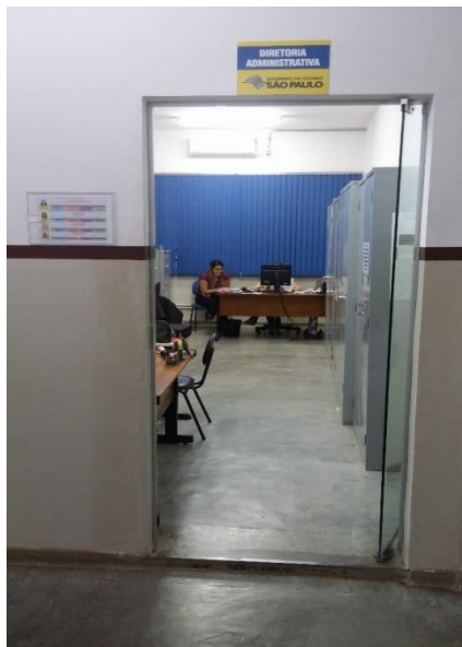
Autoria do grupo

O ambiente em questão possui quatro computadores, cinco mesas de MDF na cor madeira e uma mesa escolar padrão (branca e verde), quatro cadeiras giratórias estofadas, três cadeiras de apoio estofadas e outra, padrão escolar. Cinco armários de ferro com porta de abrir e dois armários arquivos de ferro, duas impressoras, tubulação de ferro aparente, fixados na parede para passagem da fiação, ar condicionado tipo Split e três luminárias de teto, com lâmpadas incandescentes. Conforme figuras 2,3,4,5,6,7.