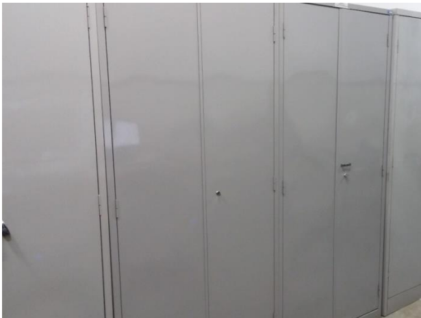
Autoria do grupo