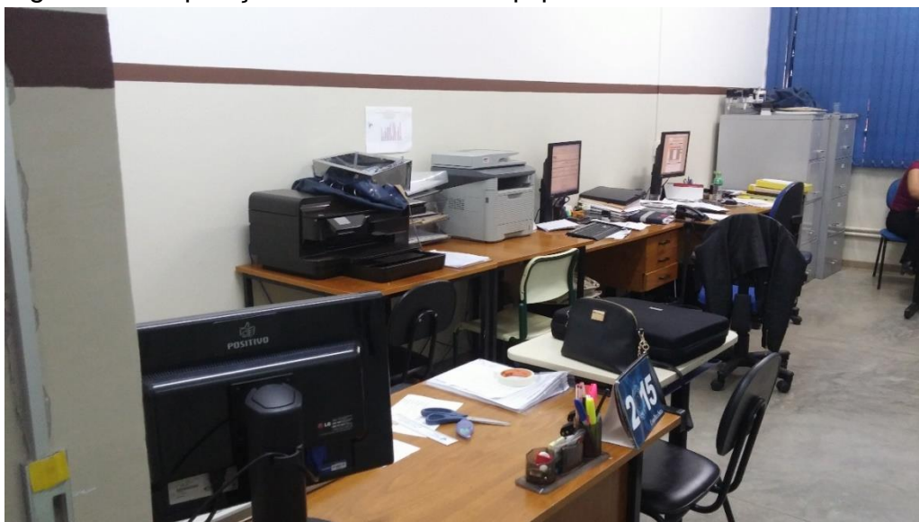
Autoria do grupo