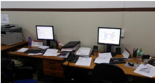
Autoria do grupo