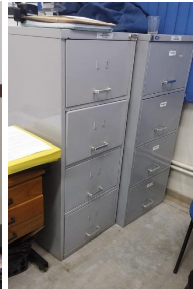
Autoria do grupo