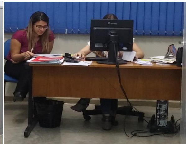
Autoria do grupo