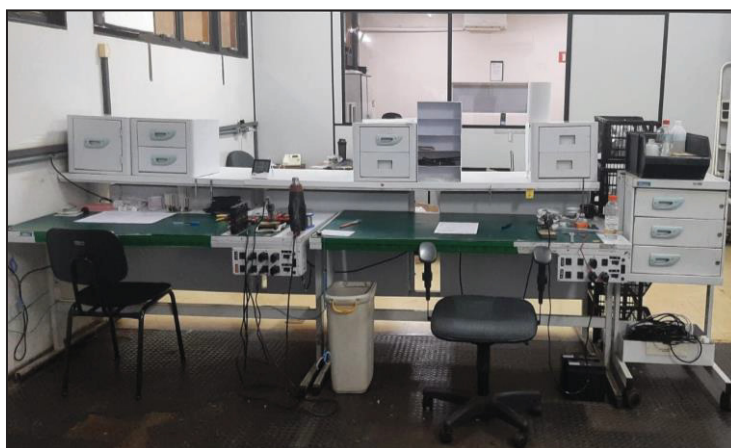
Figura 1 - Antes e depois da área de manutenção eletrônica

No armário e painel de ferramentas da Figura 2, foram revisadas e retiradas as ferramentas repetidas e transferidas para um local mais próximo da bancada afim de facilitar a locomoção e o seu acesso. De modo geral, os objetos e peças que não eram usados foram realocados para o setor correspondente, já os que não tinham mais utilidade foram descartados. Nas gavetas, os parafusos descontinuados foram remanejados e substituídos por novos compatíveis com os equipamentos, também, cada gaveta foi identificada com a descrição e código interno.