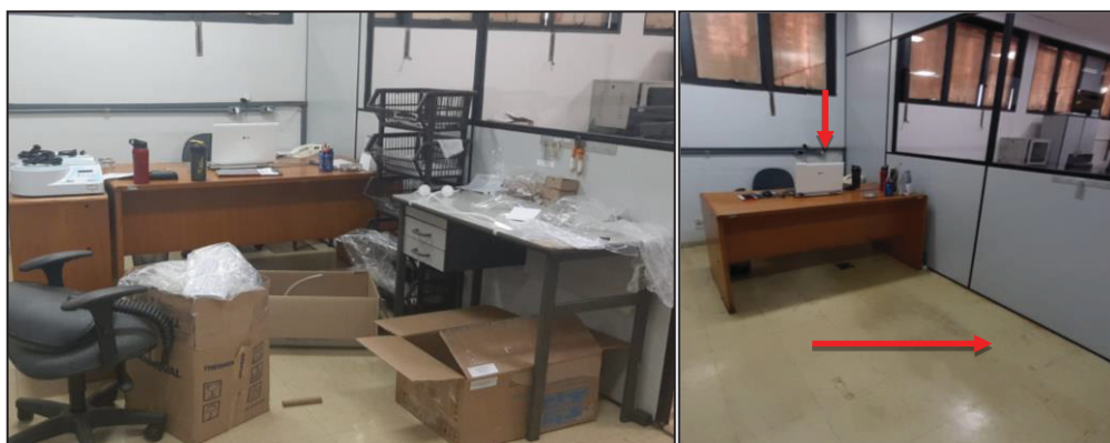
Figura 6 - Antes e depois da área administrativa

A área administrativa ficou exclusiva para uso do computador com acesso ao sistema de gestão e contatos com clientes através de e-mail. Objetos e móveis foram retirados do ambiente para garantir a manutenção da organização (Figura 6).