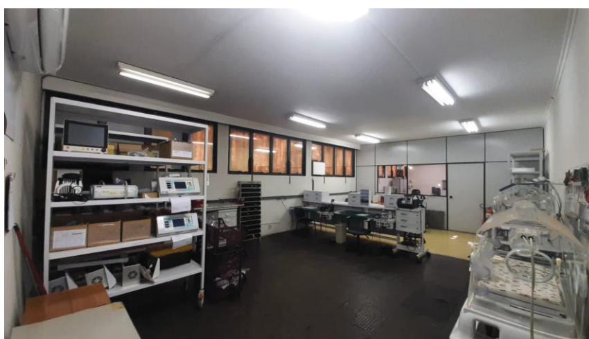
Figura 8 - Visão geral antes e depois da implantação do programa

Abaixo segue o depoimento do técnico da assistência técnica: