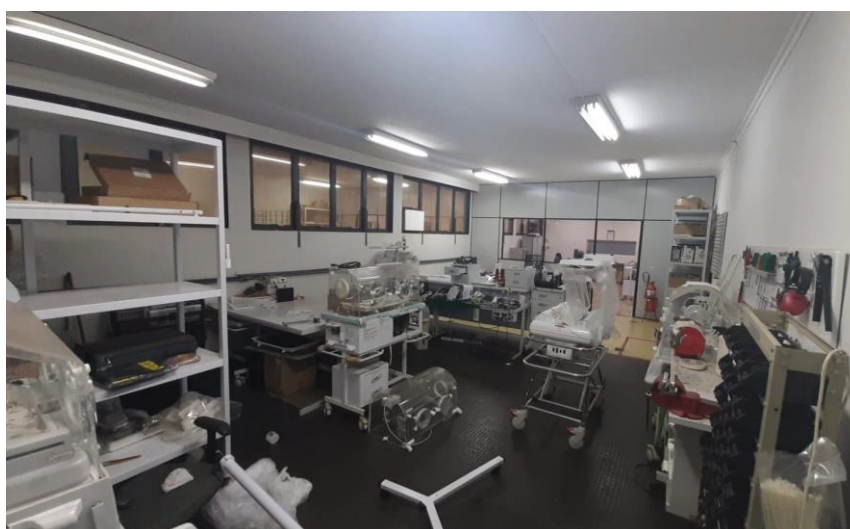
Figura 7 - Disposição da assistência antes da implantação do programa