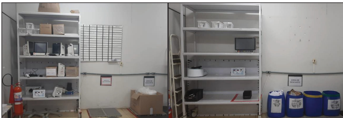
Figura 3 - Antes única prateleira para todos os equipamentos – Depois Retirada do quadro branco, criação da área de descarte e prateleira exclusiva para equipamentos

Com o objetivo de diminuir a poluição visual e melhorar o fluxo de informações das manutenções, não só foi retirado um quadro branco para os registros, como também passou-se a utilizar um software de gestão. O setor de descarte de material foi segregado em metal, papelão, plástico e lixo eletrônico. A prateleira na Figura 3 foi dividida em 3 partes, sendo elas: manutenções finalizadas, peças para analisar em garantia e produto não-conforme. Anteriormente a prateleira era usada para guardar todos os equipamentos do setor. As peças, tanto em garantia como as não-conforme, são depositadas em recipientes distintos.