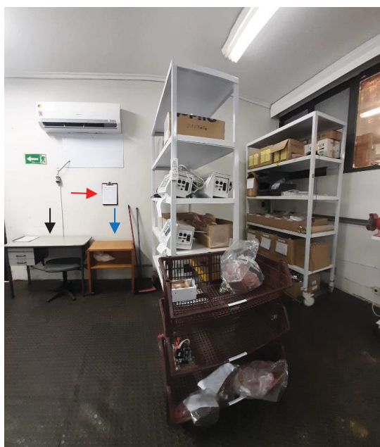
Figura 5 - Área de recebimento de equipamento

A área administrativa ficou exclusiva para uso do computador com acesso ao sistema de gestão e contatos com clientes através de e-mail. Objetos e móveis foram retirados do ambiente para garantir a manutenção da organização (Figura 6).