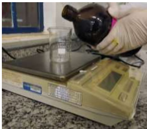
Figura 4: Pesagem da glicerina