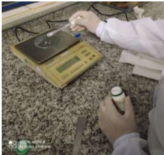
Figura 1: Pesagem do benzoato de sódio