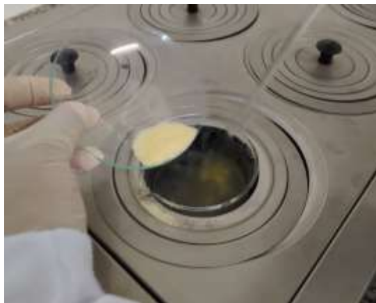
Figura 7: Adição da gelatina farmacêutica