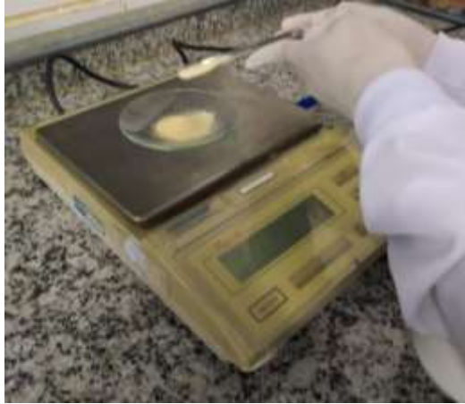
Figura 5: Pesagem da gelatina