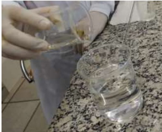
Figura 6: Homogeneização de todos os componentes com a água destilada