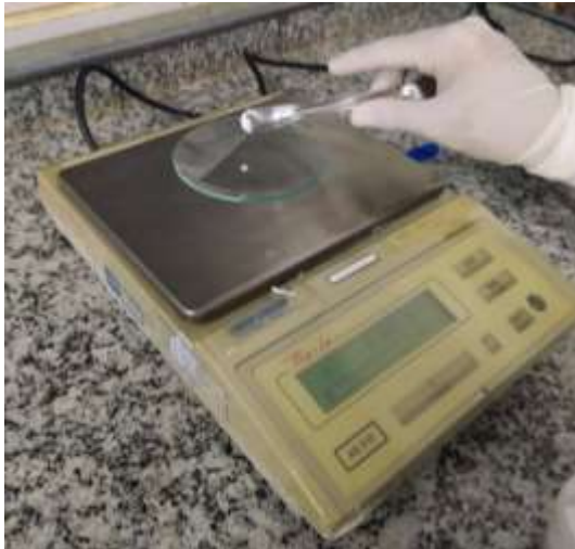
Figura 3: Pesagem da biotina