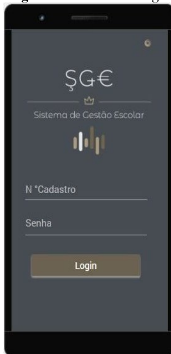
Figura 1. Tela Inicial/ Login