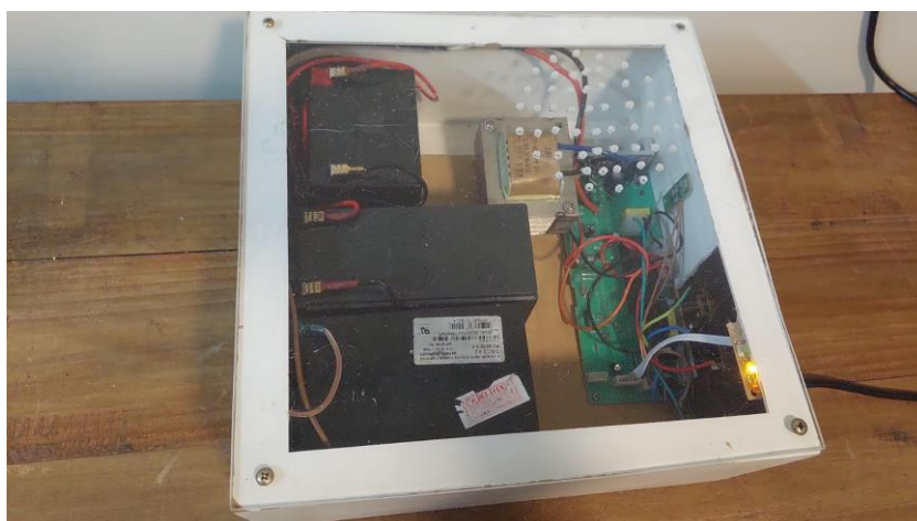
Figura 7: Nobreak