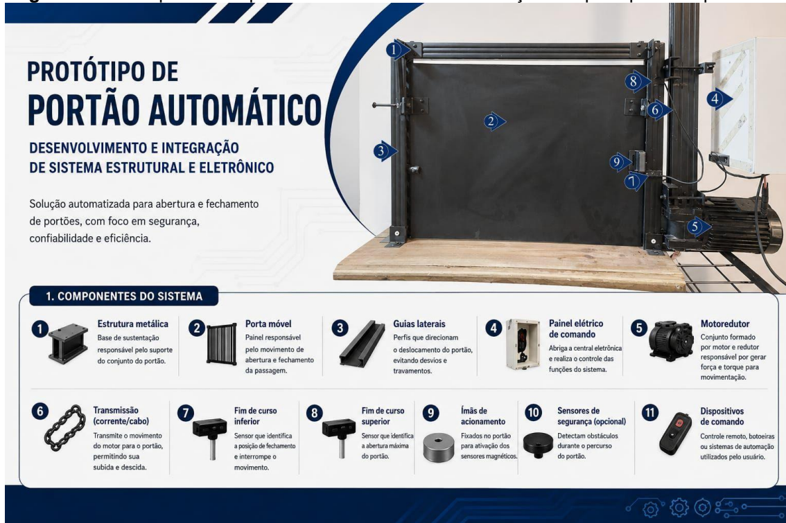
Figura 4 – Protótipo final do portão automático com identificação dos principais componentes.