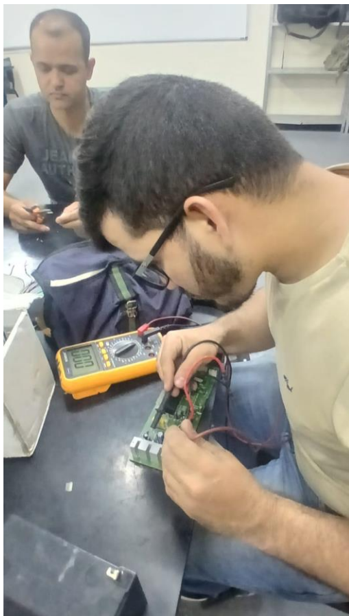
Figura 3 – configurando central de comando nice