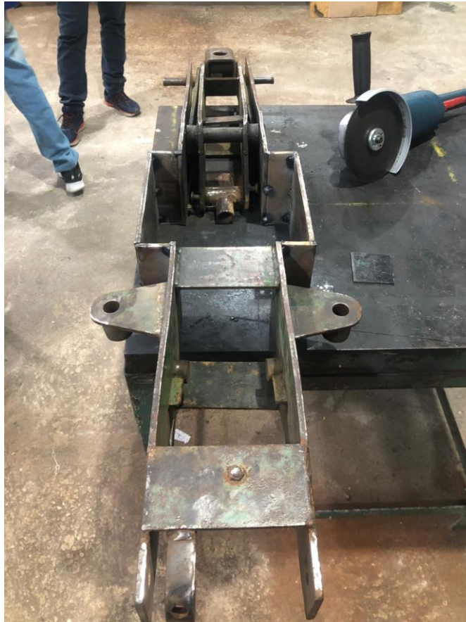
Figura 4: Processo de fixação da bolsa pneumática no macaco