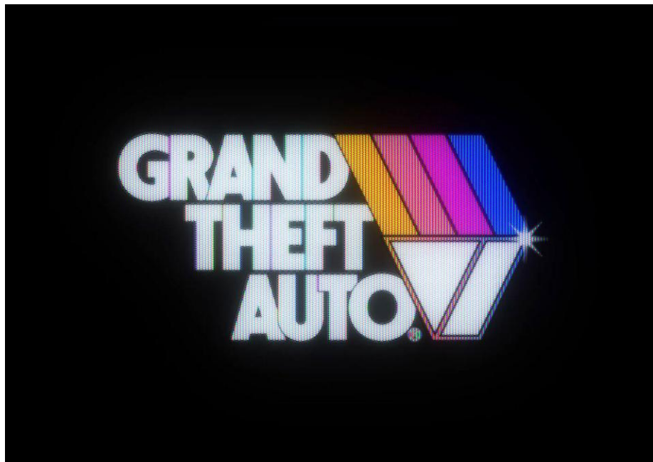
Figura 1: Logotipo refeito em estilo anos 80.

As paletas foram definidas com base em contrastes marcantes e tons luminosos, simulando a aparência dos antigos monitores CRT e o brilho característico das primeiras telas digitais. A intenção foi unir o visual vibrante do passado à legibilidade e harmonia exigidas por um design atual. 3.3. Inspirações visuais As inspirações visuais partem de logotipos refeitas, não oficiais, que resgatam o estilo retrô sob novas perspectivas de marcas consolidadas. Abaixo algumas das referências: