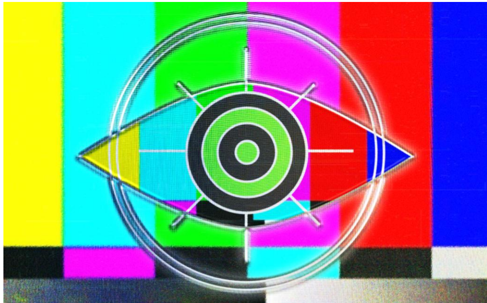
Figura 3: Projeto desenvolvido para o Youtube

A identidade visual foi definida por meio de uma união clara e relativamente simples dos elementos já previstos. Era necessário, através do repertório estético escolhido, evocar o tom da marca, cujas palavras-chave seriam vanguardismo, tecnologia, informação e cinema. Simbolismos como o olho, remetendo simultaneamente à visão, à ótica e à aparência de uma câmera, foram a base do isotipo. O uso de texturas e padrões que lembram sinais de TV, computadores antigos e televisores de tubo foi essencial para complementar o conceito, reforçando a imersão do espectador e os efeitos da nostalgia no visual. A tipografia e as cores foram escolhidas de modo a se encaixarem organicamente no conceito estético.