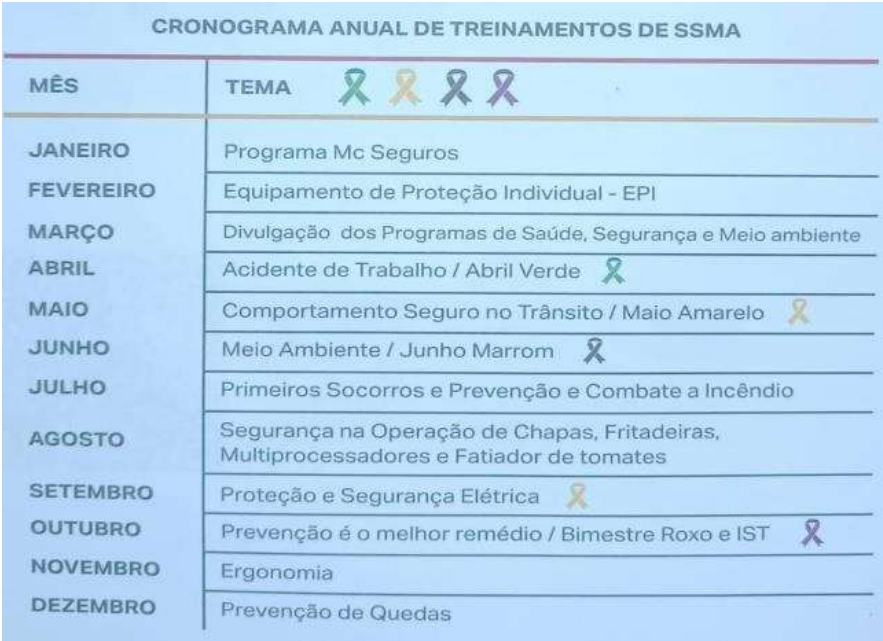
Figura 2 - Cronograma anual de treinamento de SSMA.