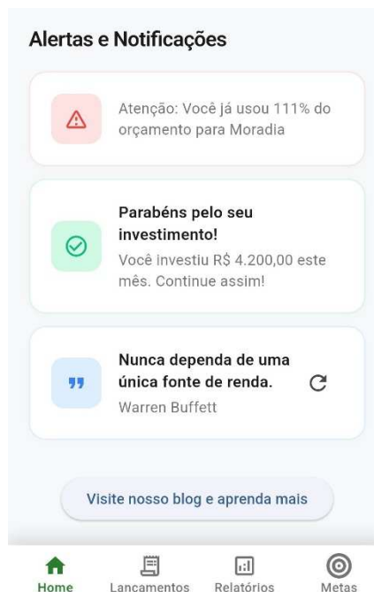
Figura 2 – Tela inicial parte 2