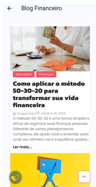
Figura 10 – Blog

A proposta do blog é estimular a reflexão e o aprimoramento contínuo dos hábitos financeiros, oferecendo conhecimento acessível e aplicável à rotina. Dessa forma, a funcionalidade contribui para o fortalecimento da educação financeira, apoiando o usuário em sua jornada de planejamento e estabilidade econômica.