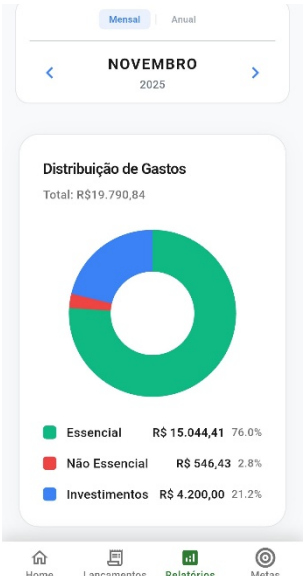
Figura 5 – Tela de relatório parte 1

sobre gestão orçamentária e incentivando o desenvolvimento de hábitos financeiros sustentáveis.