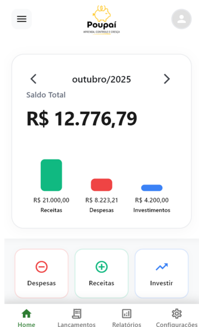
Figura 1 – Tela inicial parte 1

conteúdos sobre educação financeira e desenvolvimento pessoal, fortalecendo o caráter instrutivo e educativo do aplicativo.