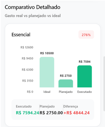
Figura 8 - Tela de relatório parte 2