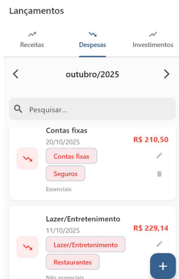
Figura 4 – Tela de Lançamentos

Nos relatórios consolidados, os dados provenientes dessa tela são utilizados para gerar análises visuais e percentuais, demonstrando, por exemplo, o percentual das receitas comprometido com despesas essenciais ou o volume destinado a investimentos. Dessa forma, a tela de lançamentos cumpre papel central no aplicativo, integrando o registro das informações com a compreensão prática do comportamento financeiro do usuário.