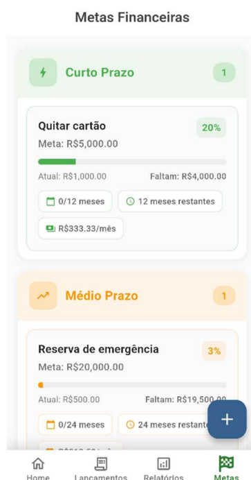
Figura 9 - Tela de Metas

Além disso, ao registrar novos investimentos, o usuário pode vinculá-los diretamente a uma meta específica, permitindo que o aplicativo atualize automaticamente o progresso, deduzindo os valores investidos e recalculando o montante restante necessário. Essa funcionalidade reforça o caráter educativo do sistema, ao demonstrar, de forma visual e prática, a importância da constância e do planejamento na construção de objetivos financeiros.