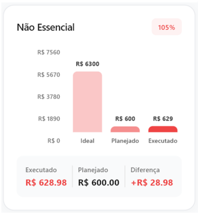
Figura 7 - Tela de relatório parte 3