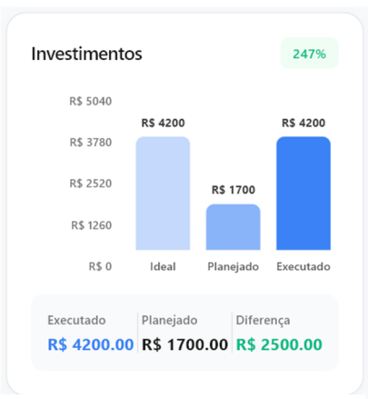
Figura 6 - Tela de relatório parte 4