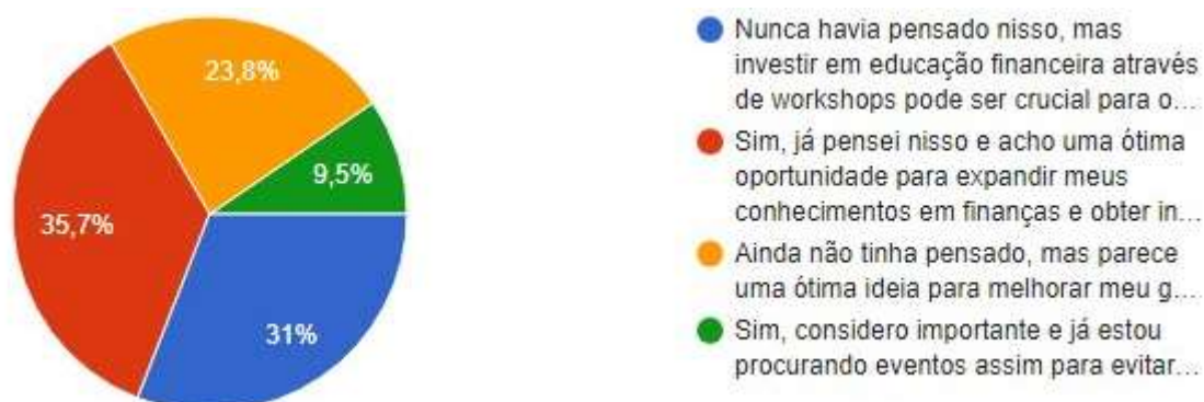
Gráfico 2 - Você já considerou a possibilidade de participar de workshops ou seminários sobre educação financeira voltados para microempreendedores?

Respondendo a segunda hipótese a compreensão dos princípios financeiros é essencial para tomar decisões informadas e estratégicas em um ambiente empresarial tendo disposição para aprender e melhorar suas habilidades financeiras para benefício de seus negócios.