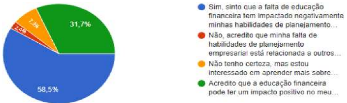
Gráfico 1 - Você sente que a falta de educação financeira tem impactado negativamente suas habilidades de planejamento empresarial?

Também foi pesquisado sobre como a educação financeira afetou diretamente o empreendimento e como a falta dela pode causar tantas oscilações. As respostas para essas informações estão apresentadas nos gráficos de I a IX a seguir: