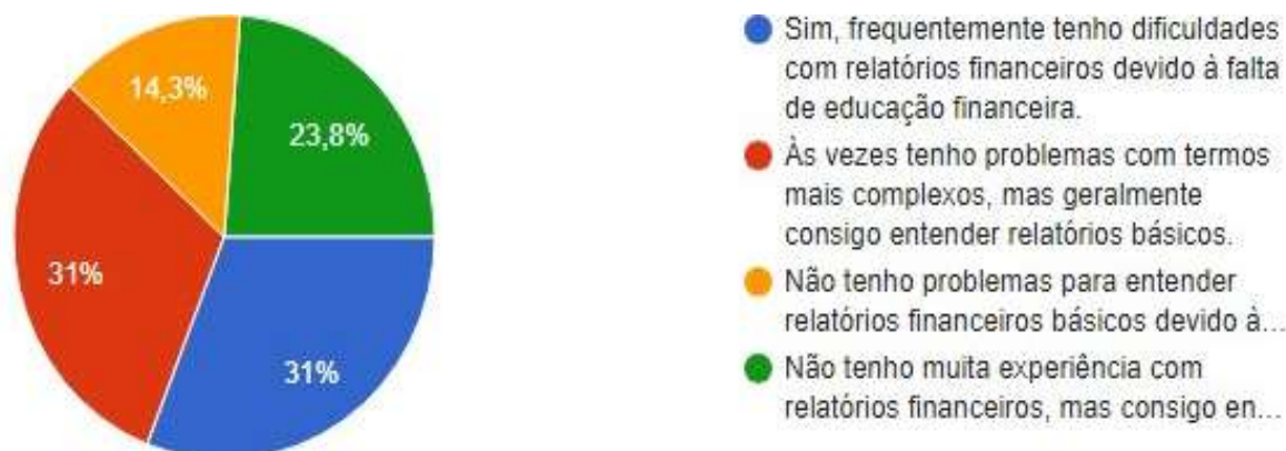
Gráfico 4 - Você já teve problemas para entender e interpretar relatórios financeiros básicos do seu negócio devido à falta de educação financeira?