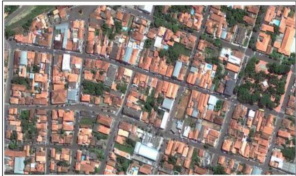
Figura 4 - Vista área do centro da cidade

A área apresentada ocorre á principal movimentação, localizada no centro da cidade com as principais atividades e comércio da cidade.