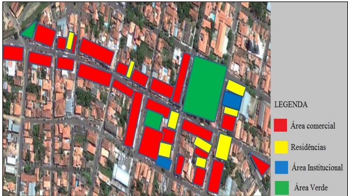
Figura 5 - Levantamento da área