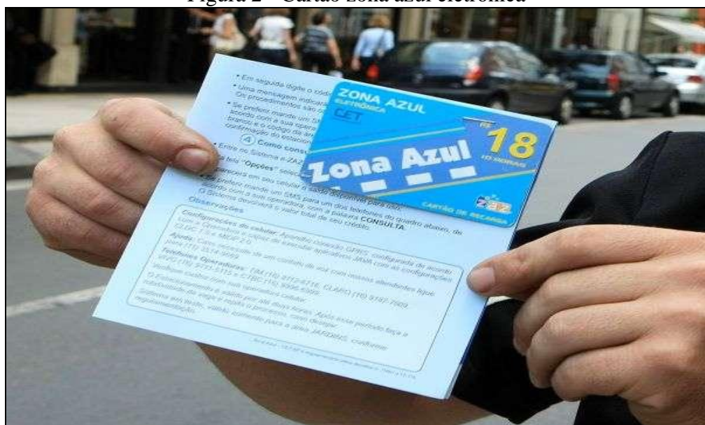
Figura 2 - Cartão zona azul eletrônica

Diante das vantagens e benefícios trazidos pelo estacionamento rotativo pago o trabalho tem como proposta avaliar a situação do Trânsito numa pequena cidade no interior de São Paulo, com o intuito de avaliar a viabilidade da implantação do estacionamento rotativo pago, zona azul.