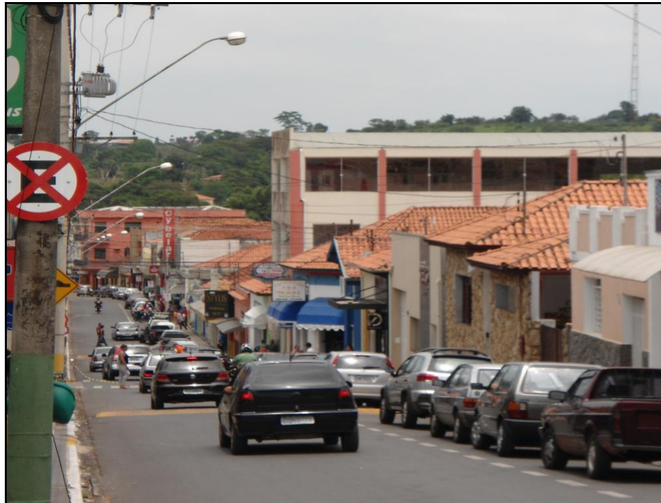
Figura 13 - Área com falta de estacionamento

Com base no que foi apresentado, a cidade enfrenta problemas com a falta de estacionamento, mau uso do espaço viário disponível e baixa infra-estrutura de investimentos para a área.