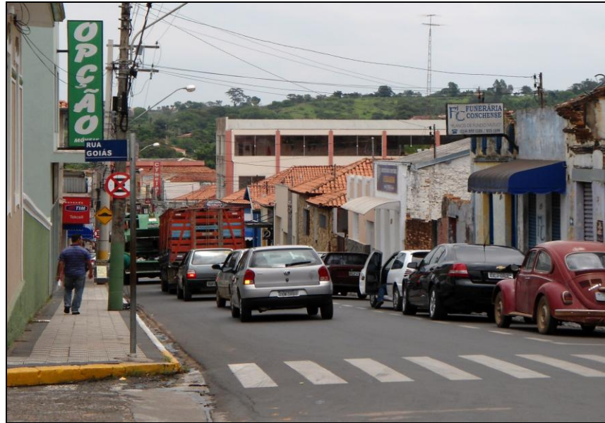
Figura 6 - Principal via da cidade

O local apresenta demarcações de solo e sinalizações de vagas restritas de acordo para a utilização nos aspectos descritos.