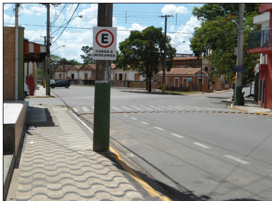
Figura 7 - Ponto de carga e descarga