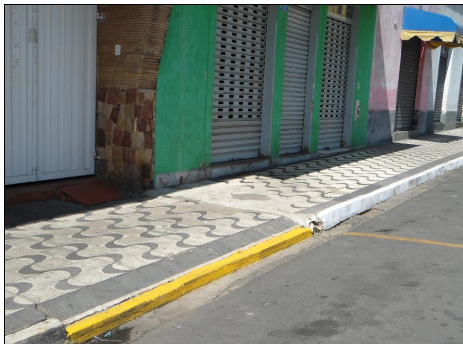
Figura 11 - Guia Rebaixada

As calçadas apresentam em sua maioria o tamanho padrão para a circulação de pedestres em média 2 metros considerando que o padrão é de no mínimo 2 metros e no caso ideal de 3 metros. As guias rebaixadas têm em média 3,5 metros, que são utilizadas para demarcar as garagens como ilustra a figura 11.