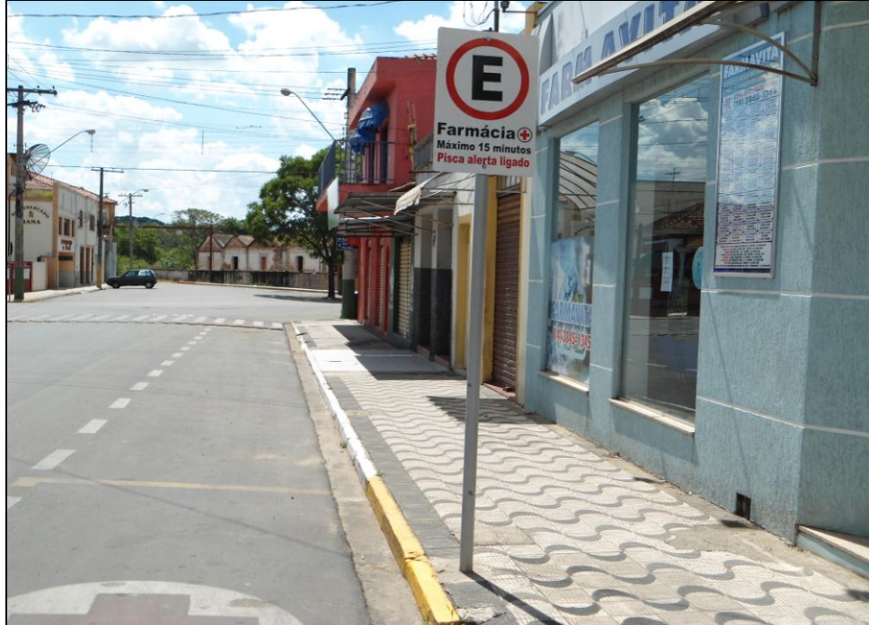
Figura 8 - Ponto de farmácia