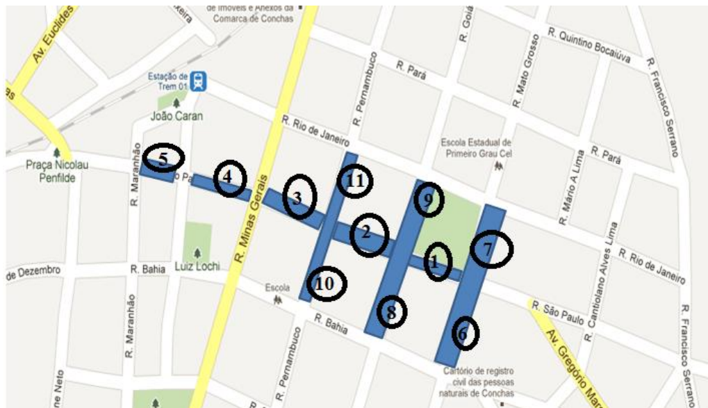
Figura 12- Demarcação da área para o estacionamento