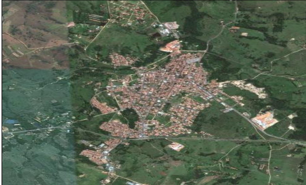
Figura 3 - Vista aérea da cidade de Conchas

Vista aérea da cidade que em sua maioria encontra-se rodeada por sítios e fazendas.