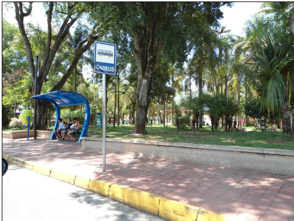
Figura 9 - Ponto de ônibus