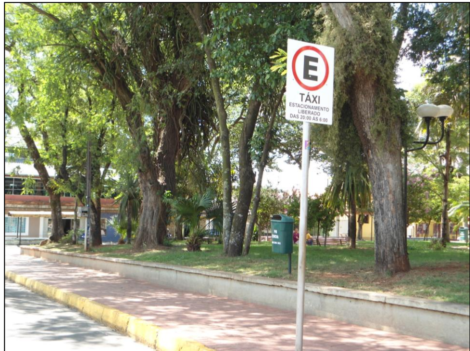
Figura 10 - Ponto de Táxi

As calçadas apresentam em sua maioria o tamanho padrão para a circulação de pedestres em média 2 metros considerando que o padrão é de no mínimo 2 metros e no caso ideal de 3 metros. As guias rebaixadas têm em média 3,5 metros, que são utilizadas para demarcar as garagens como ilustra a figura 11.