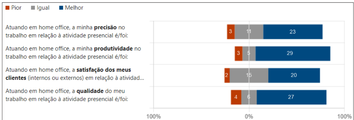
Figura 2 - Índice de percepção do desempenho profissional considerando Precisão, Produtividades, Satisfação dos Clientes e Qualidade.