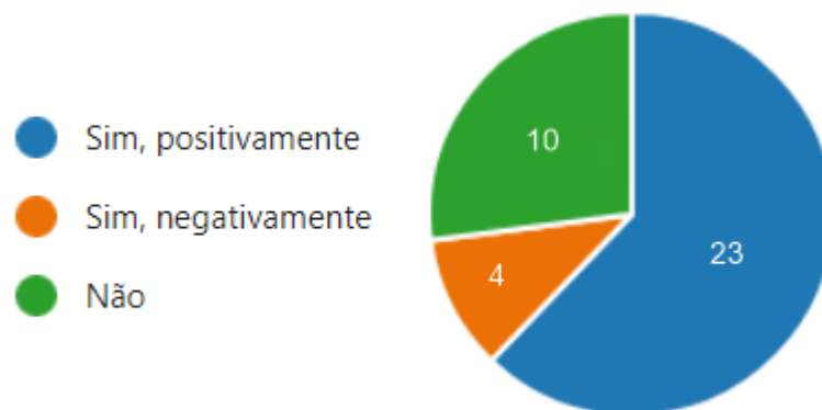
Figura 3 - Suas atividades diárias são influenciadas pelo perfil e características do seu gestor no meio profissional?

Acerca do perfil e características do gestor influenciar o entrevistado, a Figura 3 retrata a frequência dos resultados da Questão 3. Percebe-se que 72,97% dos entrevistados avaliam que suas atividades diárias são influenciadas pelo perfil e características do gestor, sendo 62,16% positivamente e 10,84% negativamente. Os demais 27,03% avaliam que suas atividades não são influenciadas.