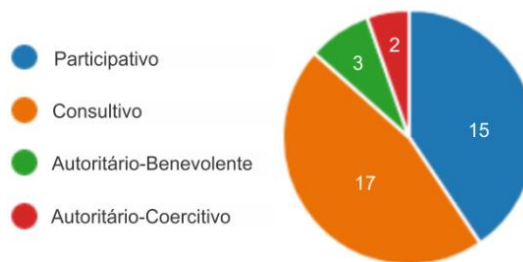
Figura 5 - Perfil do gestor.

Dos 37 resultados, 15 classificaram o gestor como Participativo, 17 como Consultivo, 3 como Autoritário-Benevolente e 2 como Autoritário-Coercitivo como observado na Figura 5.