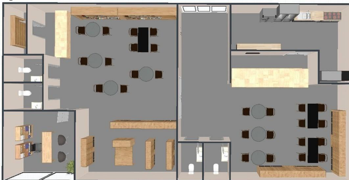
Figura 3 - Planta 3D