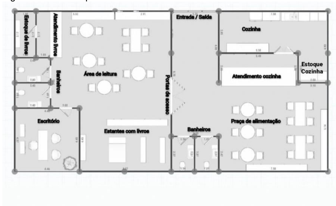
Figura 4 - Planta explicativa