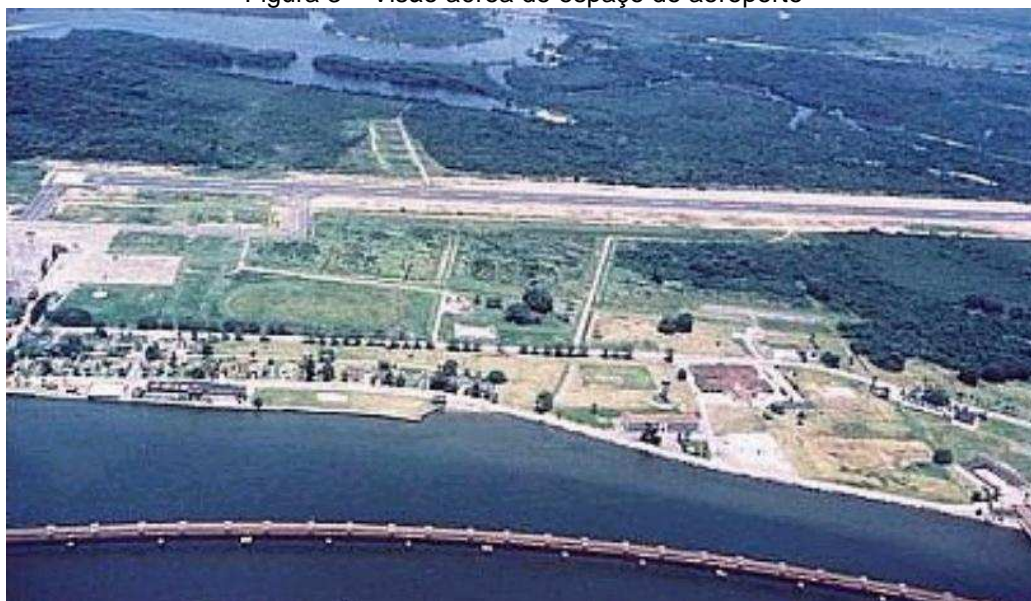
Figura 3 – Visão aérea de espaço do aeroporto