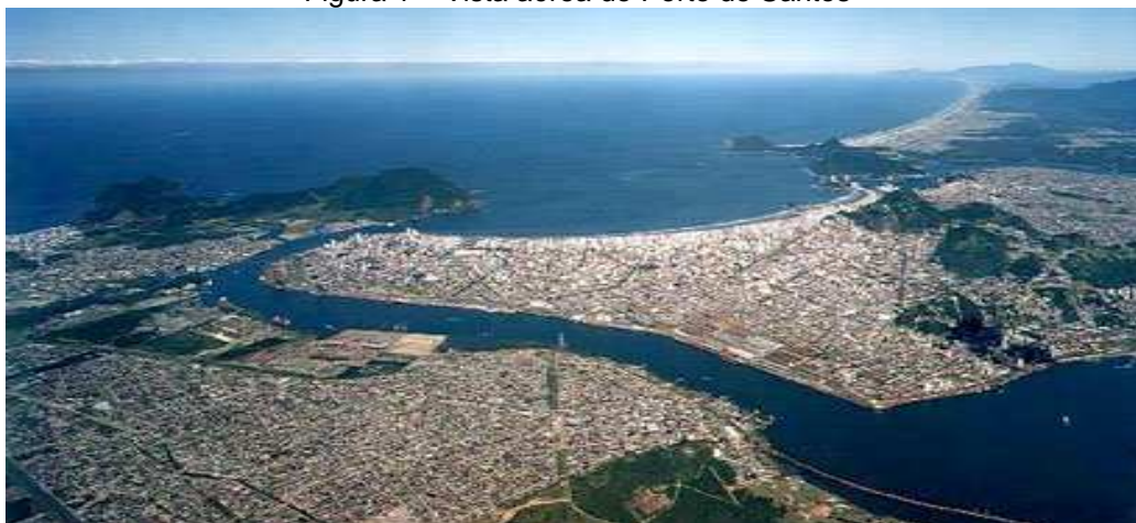
Figura 1 – Vista aérea do Porto de Santos

Está situado à costa do mar, compreendendo grandes bacias formadas por ilhotas (pequenas ilhas que se formam em torno do mar, próximas à zona da praia), no qual são utilizadas como terminais de carga, descarga e armazenagem de produtos diversos e grãos como: soja, milho, açúcar, etc.