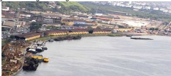
Figura 4 – Imagem da região do nascedouro do Porto de Santos

A revitalização do porto consiste em renovar áreas consideradas obsoletas com o objetivo de modernização e para que possa ser incluído como “roteiro turístico e de desenvolvimento social” (PDZPS, 2006; p. 163-164). E como proposta, o Porto de Santos têm uma região que é considerada “o espaço de maior importância histórica e cultural de Santos – nascedouro do Porto de Santos, e que deve gerar imensa expectativa de revitalização” (PDZPS, 2006; p. 164).