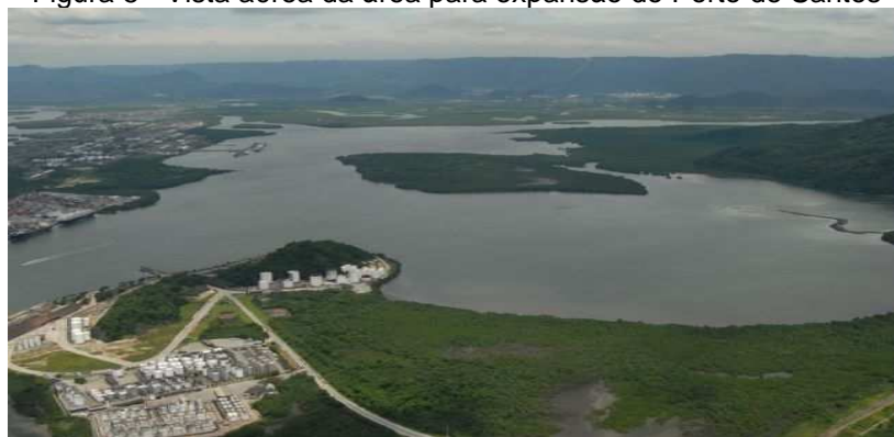
Figura 5 - Vista aérea da área para expansão do Porto de Santos